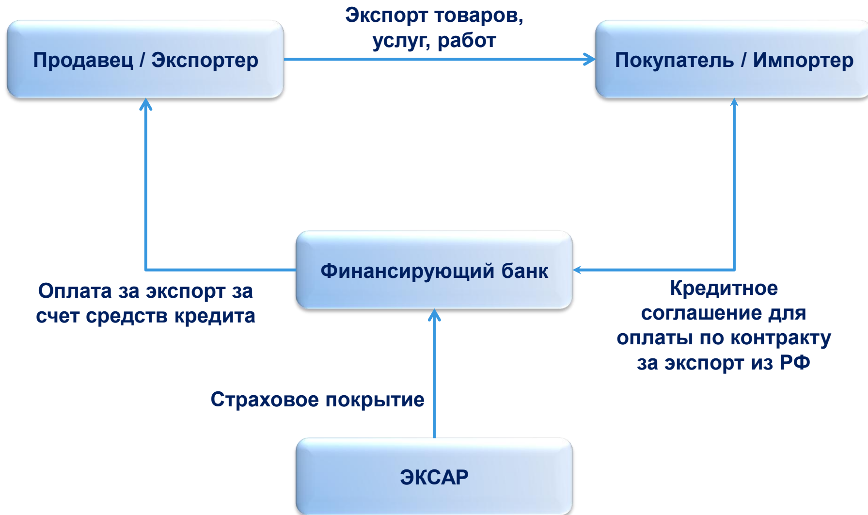
Схема взаимодействия участников структурированного через ЭКА финансирования